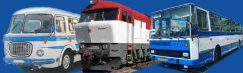
Změna vozidel vyhrazena. Ilustrační fotografie.

První dva prototypy nových traťových motorových lokomotiv T 478.1 byly v ČKD vyrobeny v roce 1964 a na jaře roku 1965 nasazeny do zkušebního provozu. Výrazně tvarované čelo z laminátu dalo lokomotivám jméno „Bardotka“. Charakteristický zvuk motoru k nám jezdí obdivovat nadšenci z celého světa. První vyrobená lokomotiva T 478.1001 je domovem v Brně.